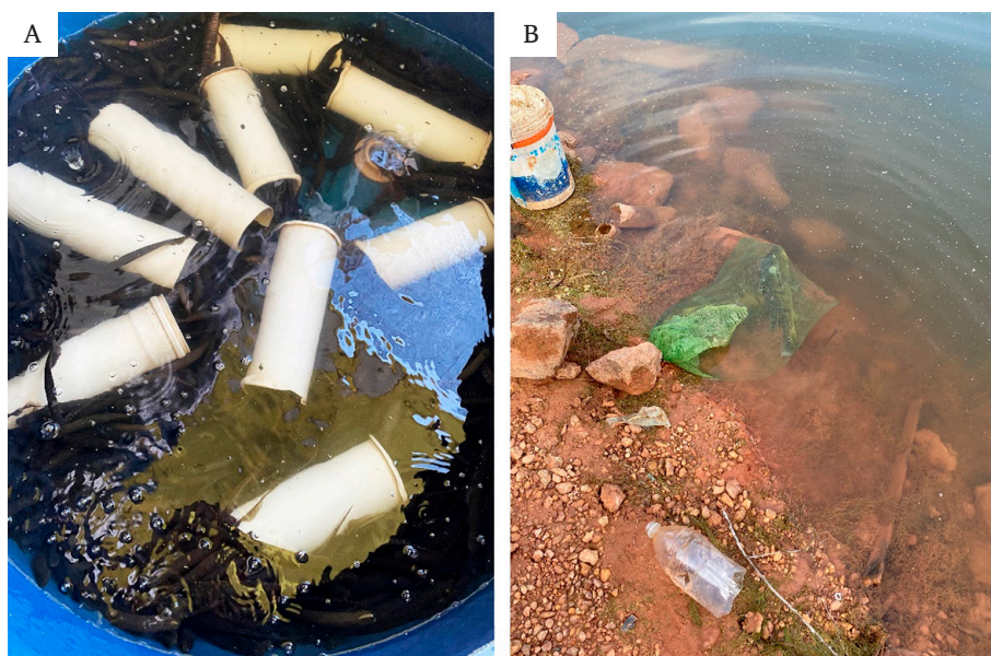
Figura 3. A- Exemplo de tambor de armazenamento dos peixes nos comércios de iscas vivas, com tuviras ( Gymnotus spp.) em altas densidades. B- Armadilhas de garrafas 'Pets' usadas para capturar peixes de pequeno porte ( carás/ piabas ) por pescadores amadores ( isqueiros ).

Em B a isca foi utilizada para captura de um tucunaré ( Cichla sp.) no lago formado pela Usina Hidrelétrica de Sinop, Sinop, MT, na localidade da Baixada Morena.